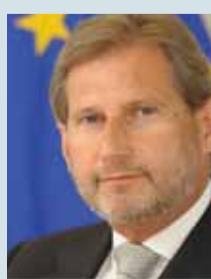
Gio Hahn Seit Februar 2010 EU-Kommissar für Regionalpolitik.