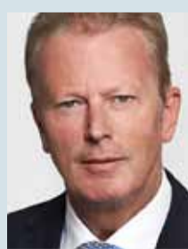
Reinhold Mitterlehner Bundesminister für Wirtschaft, Jugend und Familie