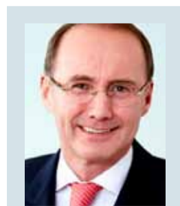
Othmar Karas Seit 2012 Vizepräsident des Europäischen Parlaments.